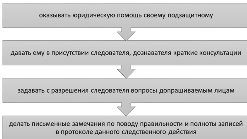
Рис. 2 – Права защитника при участии в следственном эксперименте

оценить все версии, которые находятся в разработке у следствия. Также адвокат имеет право подать ходатайство об обязательном проведении следственного эксперимента, если посчитает, что результаты, которые будут получены в результате его проведения могут повлиять на укреплении позиции со стороны защиты.