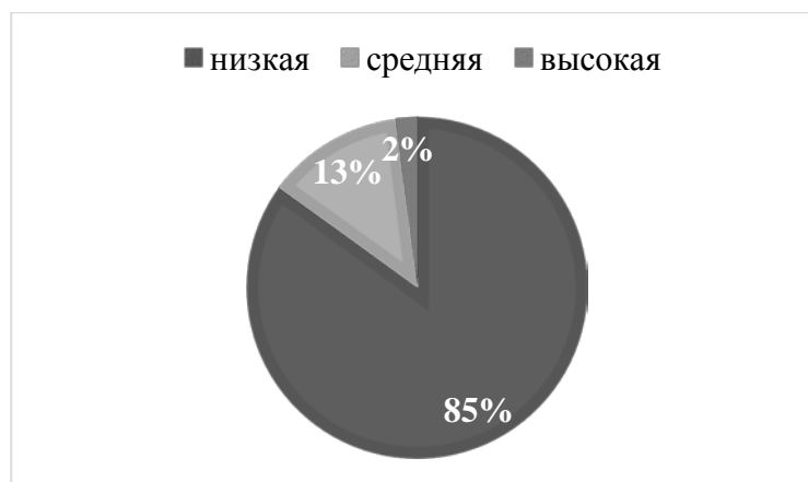
Рис.5 Результаты исследования, проведённого с помощью опросника «Коммуникативная толерантность» В. В. Бойко, шкала «Стремление переделать партнера»

На основе рисунка 5 можно сделать следующие выводы: