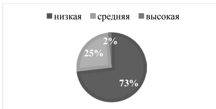
Рис.6 Результаты исследования, проведённого с помощью опросника «Коммуникативная толерантность» В. В. Бойко, шкала «Желание сделать партнера удобным»

На основе рисунка 6 можно сделать следующие выводы: