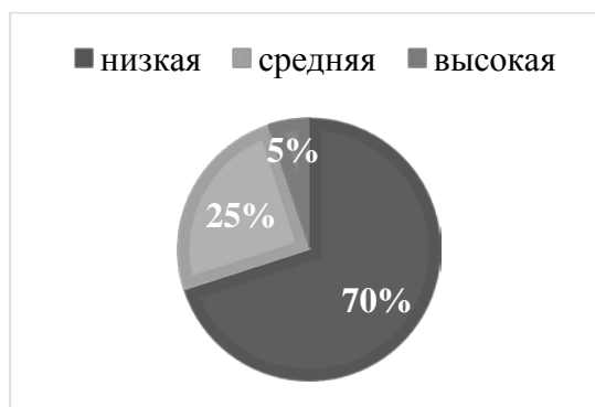
Рис.7 Результаты исследования, проведённого с помощью опросника «Коммуникативная толерантность» В. В. Бойко, шкала «Неумение прощать ошибки»

На основе рисунка 7 можно сделать следующие выводы: