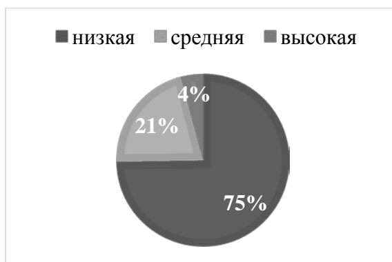
Рис.2 Результаты исследования, проведённого с помощью опросника «Коммуникативная толерантность» В. В. Бойко, шкала «Использование себя как эталона»

На основе рисунка 2 можно сделать следующие выводы: