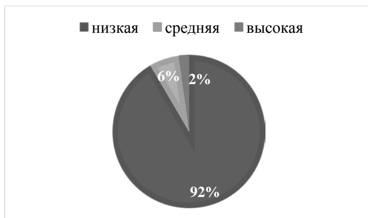
Рис.8 Результаты исследования, проведённого с помощью опросника «Коммуникативная толерантность» В. В. Бойко, шкала «Нетерпимость к дискомфорту»

На основе рисунка 8 можно сделать следующие выводы: