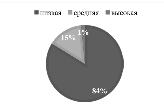
Рис.4 Результаты исследования, проведённого с помощью опросника «Коммуникативная толерантность» В. В. Бойко, шкала «Неумение скрывать чувства»

На основе рисунка 4 можно сделать следующие выводы: