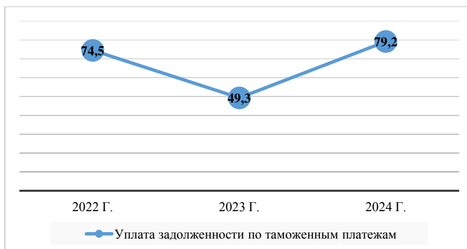
Рисунок 1 – Динамика взыскания задолженности по уплате таможенных платежей и пеней в 2022-2024 годах, млрд. рублей [7,8]

Ежегодно Федеральной таможенной службой предоставляются данные о взыскании задолженности по уплате таможенных платежей и пеней. На рисунке 1 представлены общие данные. Так, в 2024 году взыскано задолженности на сумму 79,2 млрд. рублей, в 2023 году – на сумму 49,3 млрд. рублей и в 2022 году – на сумму 74,5 млрд. рублей. В 2024 году взыскано на 6,3% больше, чем в 2022 году и на 60,6% больше, чем в 2023 году.