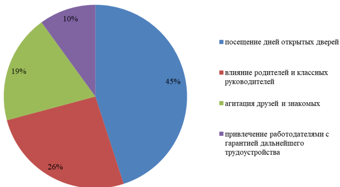
Рис – 2 Результаты анкетирования студентов первого курса инженерного факультета (составлено автором)

Для первокурсников основными показателями стали: наиболее значимые источники информации о выбранном факультете и университете; 45% посещение дней открытых дверей; 26% влияние родителей и классных руководителей при выборе; 19% агитация друзей и знакомых уже закончивших наш университет и 10% привлечение работодателями с гарантией дальнейшего трудоустройства (рис. 2).