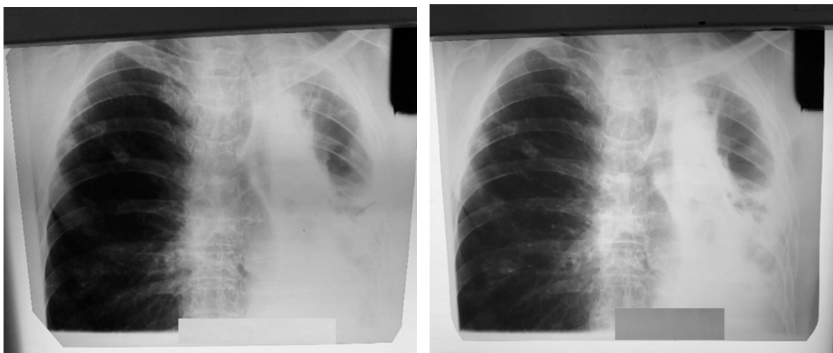
Рис.4 Обзорная рентгенограмма ОГК от 27.09.24 Рис.5 Обзорная рентгенограмма ОГК от 22.10.24

Обзорная рентгенограмма ОГК от 27.09.2024(Рис.№4) в сравнении с 22.10.2024 (Рис.№5)