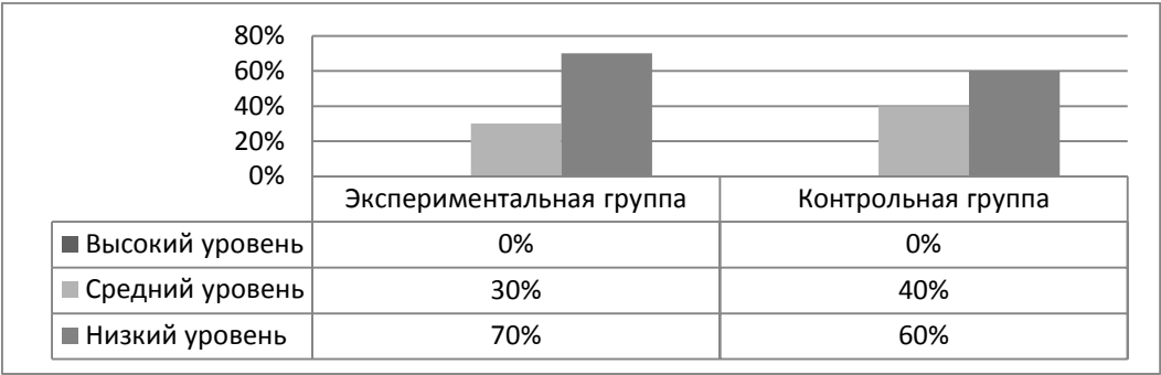
Рис.1 – Уровень сформированности тезауруса (первичная диагностика)

Следует отметить, что в исследовании приняли участие 20 детей старшего дошкольного возраста с ОНР 3 уровня, которые на основании первичной оценки результатов констатирующей диагностики были условно разделены на 2 относительно равные (по количеству и симптоматике) группы (контрольную и экспериментальную). Результаты диагностического этапа представлены на диаграмме (рис.1).