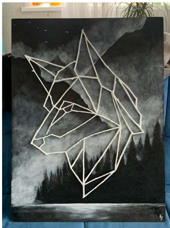
Рис.8 – Итоговая картина

краской. Склейка с подрамником (итоговым фоном Рис.7) осуществлялась клеем пистолетом.