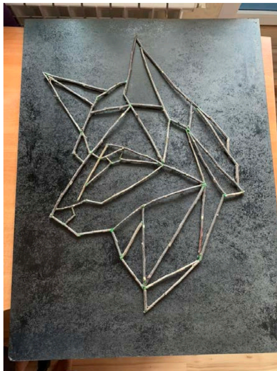
Рис.5 – Примерка

Прорисовка фона осуществлялась белой акриловой краской (Рис.6, Рис.7).