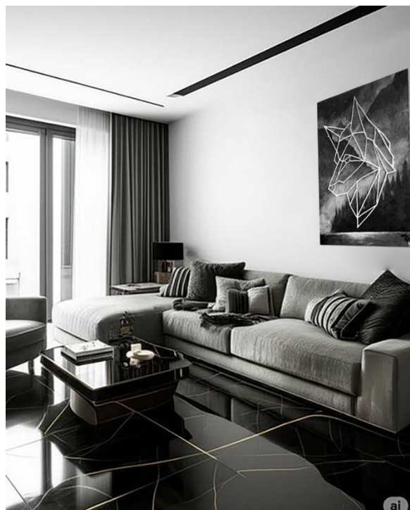
Рис. 10 – Интерьер №2