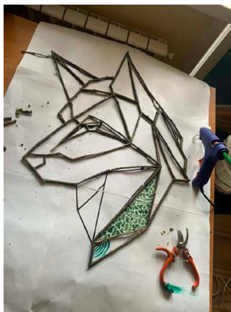
Рис.4 – Склейка и подгонка геометрии волка

5. Примерка волка и прорисовка фона. Примерка волка нужна была для понимания расположения и композиции фона (Рис.5).