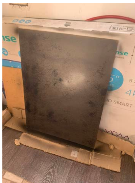
Рис.2 – Покрашенный подрамник