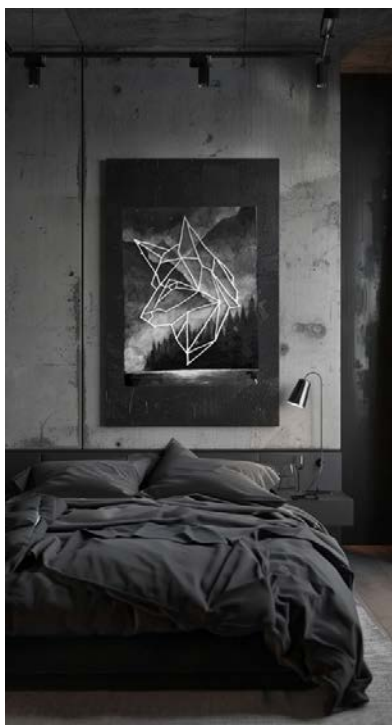
Рис. 9 – Интерьер №1

Картина, встроенная в интерьер, показана на рисунках 9 и 10.