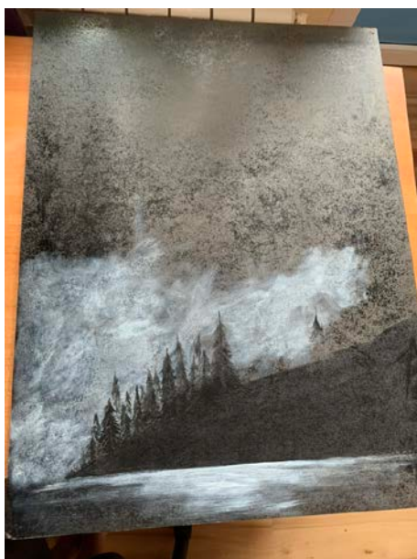
Рис.6 – Начало прорисовки фона

Прорисовка фона осуществлялась белой акриловой краской (Рис.6, Рис.7).