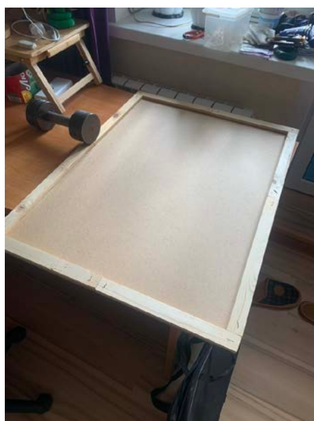
Рис.1 – Изготовление подрамника

2. Нанесение чёрной краски на подрамник (Рис.2).