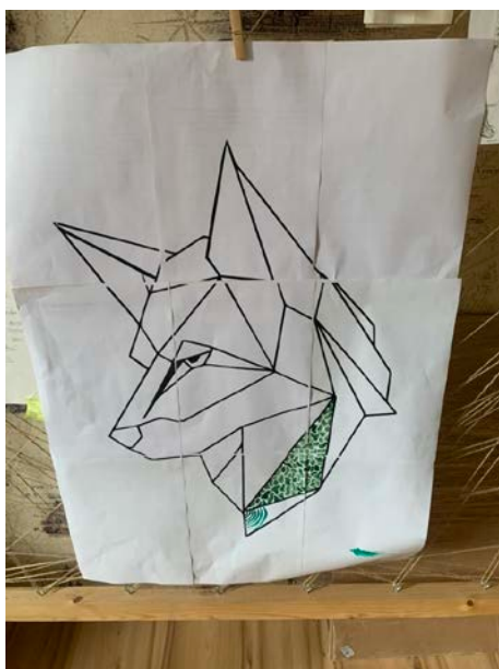
Рис.3 – Распечатанная геометрия волка

4. Склейка и подгонка стеблей белой смородины под геометрический рисунок волка (Рис. 4). Склейка осуществляется клей-пистолетом. Для подгонки под размеры использовался секатор.