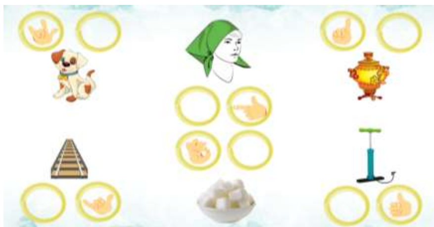
Рис.3. - Иллюстрация к заданию 4

Задание 4. Ребенку предлагается посмотреть на иллюстрацию и жест к этой иллюстрации, назвать то, что изображено при сопровождении движением противоположной руки.