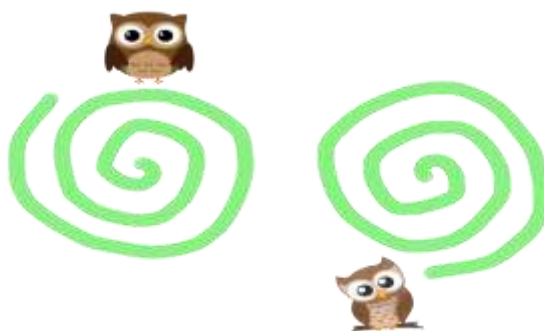
Рис. 1. - Иллюстрация к заданию 1

Ребенку предлагается изображение со спиральями, далее он должен одновременно вести пальцами обеих рук по спиральям и произносить заданный звук. В данном задании развиваем правильное произношение звука, межполушарное взаимодействие и мелкую моторику.