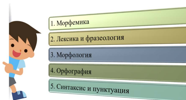
Рис.1 – Разделы русского языка