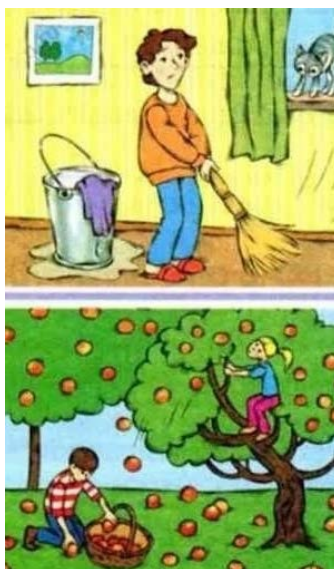
Рис.3 – Задание на описание картинки

Задание со звездочкой: Рассмотрите картинки. Ваша задача – описать каждое изображение как можно подробнее одним предложением. Определите, простое или сложное предложение вы использовали в каждом случае.