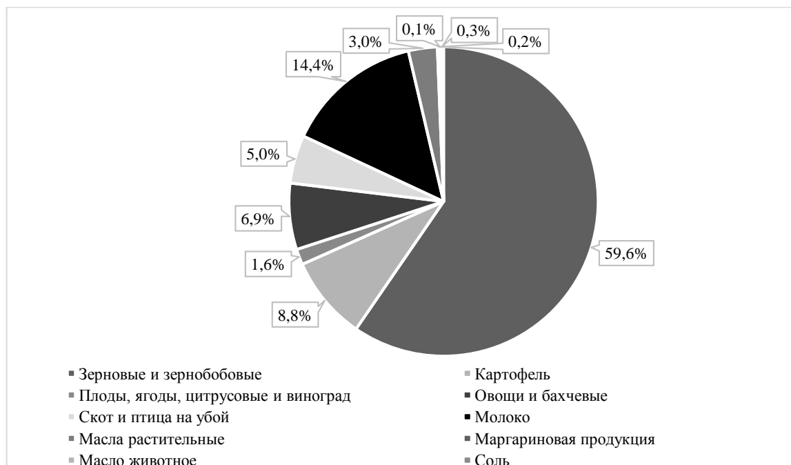
Рис. 2 – Производство некоторых видов сельскохозяйственной продукции и продовольствия на душу населения в России в 2020 году [2]

Одной из главных отраслей пищевой промышленности является молочная промышленность, для повышения производства которой необходимо увеличение мощности предприятия и количества затрачиваемых ресурсов и сырья, что приводит к увеличению количества отходов, сточных вод и выбросов загрязняющих веществ в атмосферу.