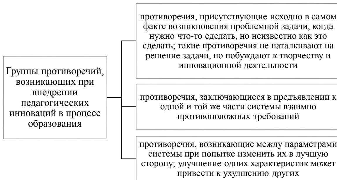
Рис. 3 – Противоречия внедрения педагогических инноваций [2]

Несмотря на очевидные преимущества, получаемые от внедрения педагогических инноваций, в научной литературе открытым остаётся вопрос определения эффективности внедряемых педагогических инноваций. М.С. Саидзода выделяет ряд противоречий в области внедрения педагогических инноваций, которые в общем виде можно разделить на три группы (рис. 3).