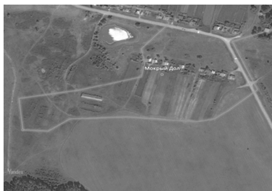
Рис. 2 – Земельный участок, предлагаемый для размещения фермы на публичной кадастровой карте

На данной территории существуют все необходимые условия для создания молочной фермы (равнинная поверхность для выпаса скота, обеспечение водой) и земельный участок находится достаточно близко к дорогам и иным коммуникациям.