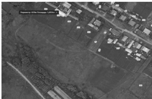
Рис. 3 – Земельный участок, предлагаемый для отведения земли под ИЖС на публичной кадастровой карте

В границах жилой зоны предлагается разместить проектируемые индивидуальные или блокированные жилые дома, обслуживающие их объекты инженерной и транспортной инфраструктуры (рис. 3, 4). Ограничений по размещению данных объектов не имеется.