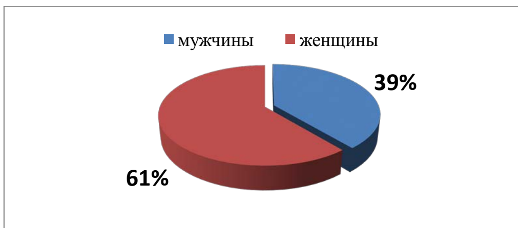
Диаграмма 1. Половое распределение пациентов с диагнозом анальная трещина.

Полученные данные свидетельствуют о том, что основную группу риска по возникновению анальной трещины занимают женщины, так как частота встречаемости данной патологии у представителей женского пола выше, чем у мужского. Связано это с тем, что одной из возможных причин возникновения данного заболевания является физиологическое родоразрешение, обеспечивающее продолжение рода, а другой причиной является тот факт, что женщины обладают пространством, где проходит схождение вульвы, влагалища и анального канала – «слабое звено».