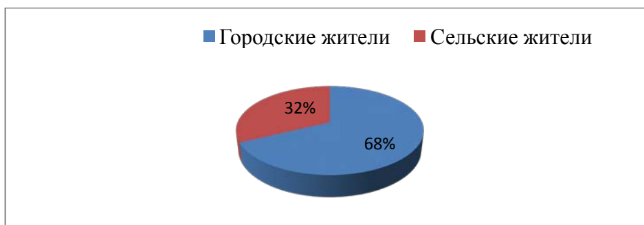
Диаграмма 4. Распределение больных с анальной трещиной по месту жительства.

Из диаграммы 4 следует, что анальная трещина встречается чаще у городских жителей, чем у сельских. Данную закономерность можно объяснить тем, что сельские жители ведут более активный образ жизни, который благотворно влияет на моторику кишечника и обеспечивает качественное опорожнение в отличие от городских людей. Так же у представителей сельских регионов в рационе питания присутствует больше растительной клетчатки, и как отмечалось выше, растительная клетчатка в питании является профилактикой запоров, являющихся одной из главных причин возникновения анальной трещины. А также физиологический акт дефекации у людей, проживающих в сельской местности, обеспечивается в условиях нахождения на корточках.