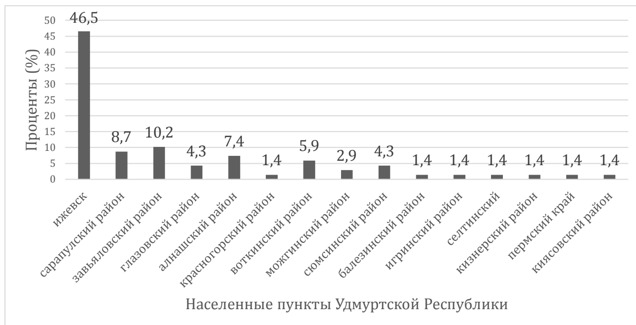
Рис. 4. Структура заболеваемости раком легких среди пациентов, проживающих в различных населенных районах УР (%). Примечание: изображение авторская разработка.

46,5 % заболеваемости раком легких наблюдается у пациентов, проживающих на территории г. Ижевск, 10,2% – Завьяловский район, 8,7% - Сарапульский район 7,4 – Алнашский район, 5,9% - Воткинский район, 4,3% - Глазовский и Сюмсинский район, 1,4% - Красногорский, Балезинский, Игринский, Селтинский, Кизнерский, Киясовский и Пермский край.