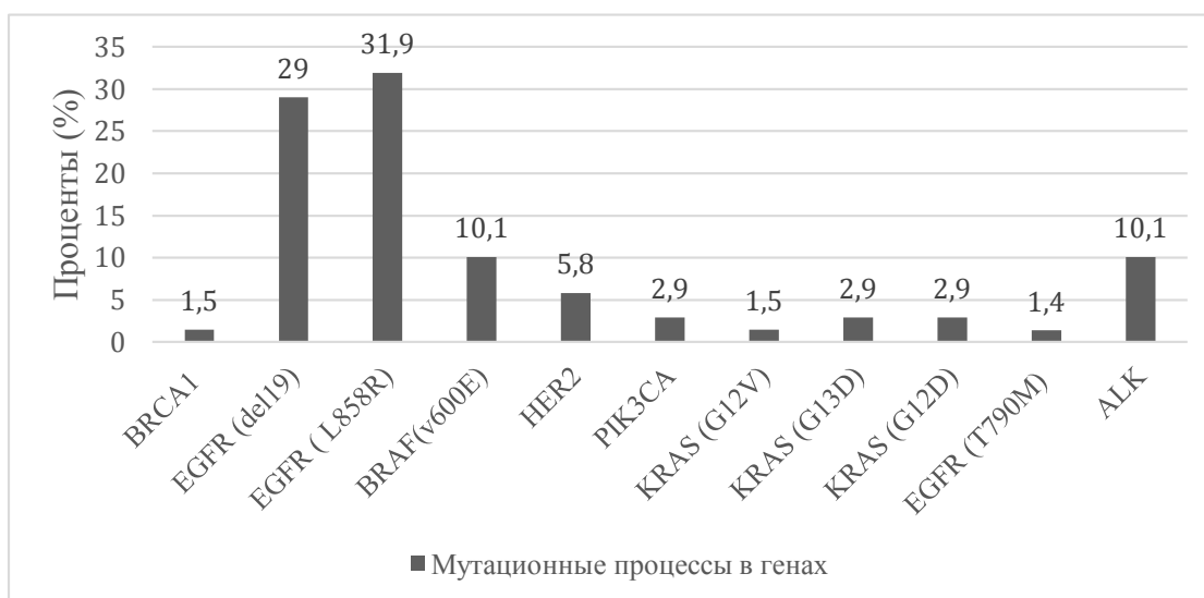
Рис 1. Мутационные процессы в генах, у пациентов обратившихся в Республиканский клинический онкологический диспансер (РКОД) Министерства здравоохранения Удмуртской Республики им. С.Г. Примушко в г. Ижевске, приводящие к раку легкого в (%). Примечание: изображение авторская разработка.

Наиболее часто мутационные процессы у пациентов обратившихся в Республиканский клинический онкологический диспансер (РКОД) Министерства здравоохранения Удмуртской Республики им. С.Г. Примушко в г. Ижевске охватывали ген EGFR в различных участках: это делеции в 19 экзоне (Del19) – 29% и замена L858R в 21 экзоне – 31,9%. На втором месте в процентном соотношении находятся гены: BRAF и ALK, которые составляют 10,1% каждый. Меньше всего мутационный процесс затрагивает ген EGFR с заменой аминокислотного остатка треонина на метионин в 790 положении - 1,4% и ген KRAS (G12V) - 1,5% (рис.1.).