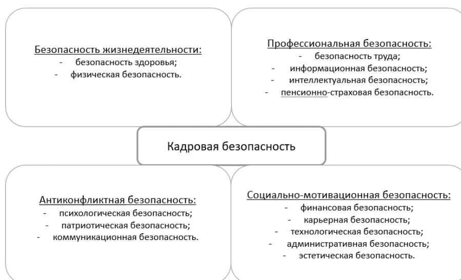
Рисунок 1 – Структура кадровой безопасности [5]

Кадровую безопасность можно разделить на следующие составляющие: безопасность жизнедеятельности, профессиональная, социально-мотивационная и психологическая безопасности. Структура представлена на рисунке 1.