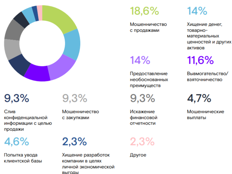
Рисунок 2 – Результаты исследования видов нарушений со стороны сотрудников [3]

Мошенничество – это угроза для развития компании. Поэтому необходимо контролировать персонал: общаться с клиентами и использовать инструменты, которые помогут заранее выявить теневые схемы.