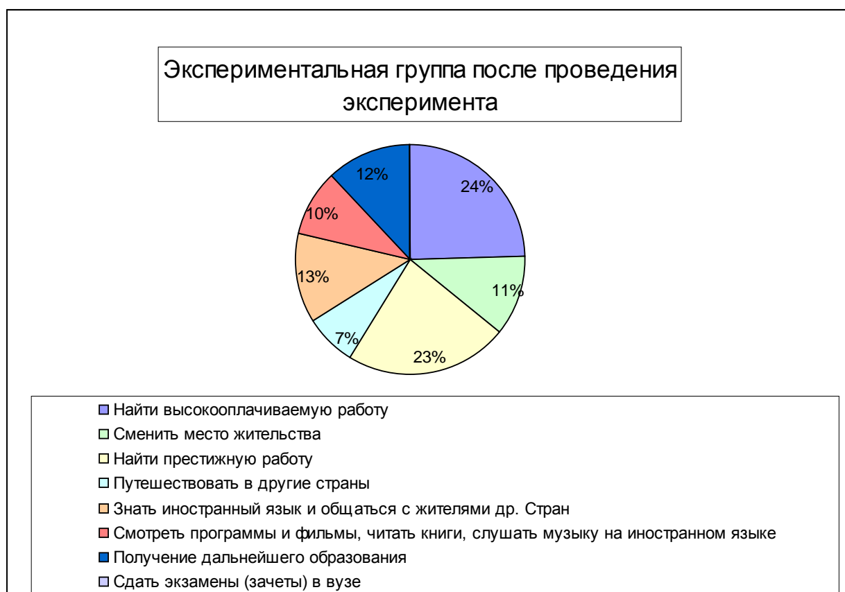
Рис. 2 – Цели изучения иностранного языка

При анализе целей изучения дисциплины были отмечены определенные трансформации (рис. 2)