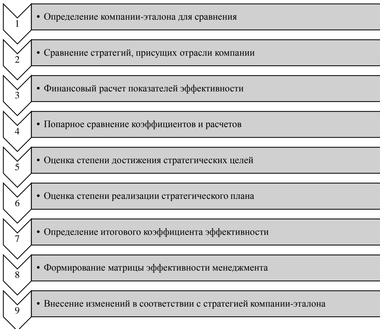
Рис. 1 – Алгоритм диагностики качества менеджмента организации (Составлено автором)

Таким образом, алгоритм диагностики качества менеджмента организации состоит из многих этапов, каждый из которых ответственен за свои задачи. Результатом диагностики должна выступать матрица эффективности и внесение изменений в соответствии с стратегией компании-эталона. Корректировка собственной стратегии развития позволит устранить основные недостатки, имеющие негативное влияние на эффективность и результативность управленческой деятельности менеджеров организации.