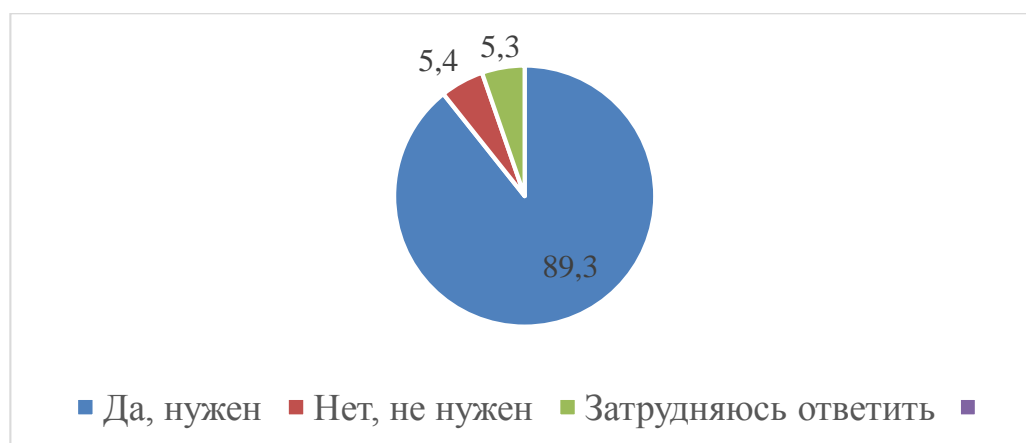
Рис. 1 - Оценка необходимости информационной открытости государства и социального контроля за деятельностью органов власти, % 1

На первом этапе исследования и экспертам, и респондентам было предложено ответить на вопрос о необходимости государственной открытости и социального контроля. Абсолютное большинство респондентов (89,3 %) сошлись на мнении, что современной России нужен механизм, позволяющий государству открыто транслировать свою деятельность, а гражданам позволять контролировать данные процессы (рис. 1).