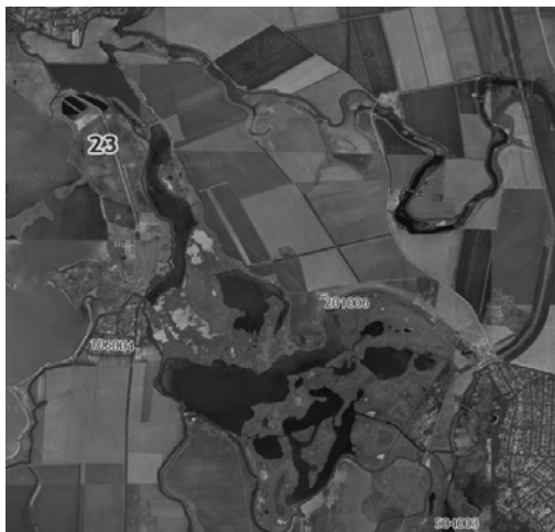
Рис. 1 – Скриншот кадастрового квартала 23:04:0201006 из сервиса Публичная кадастровая карта