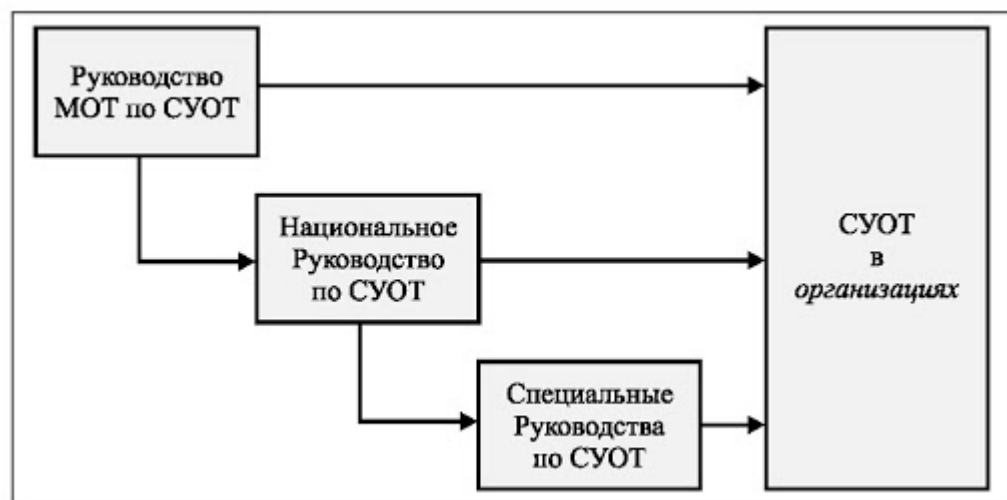
Рис 3 Руководство по системе управления охраны труда[6, 88-90]

Система управления охраной труда предназначена для мониторинга деятельности предприятия на предмет соблюдения стандартов и правил охраны труда непосредственно работниками в процессе производства. В обязанности руководителя входит создание этой системы управления лично или она также имеет право передать эту обязанность должностному лицу по своему выбору.[9, 171-173]