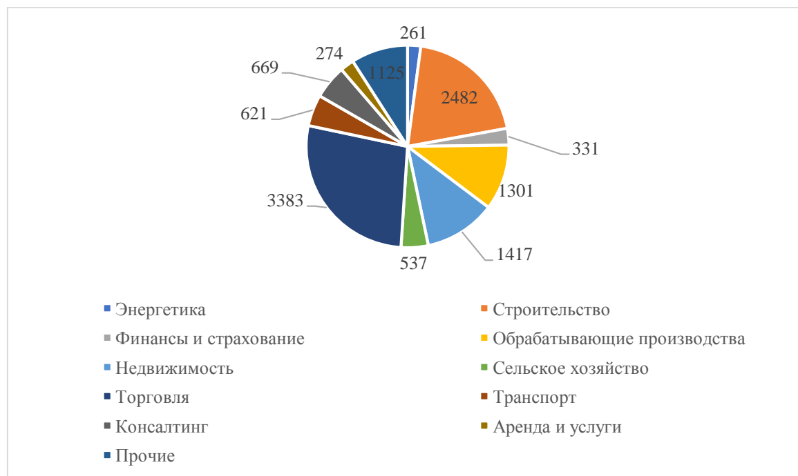
Рисунок 2. Масштабы банкротств в отраслях Российской Федерации в 2019 г. 5

В 2019 году на Российском рынке было выявлено 3,4 тысячи компаний банкротов в отрасли торговли, 2,5 – в строительстве и 1,4 тысячи пришлось на рынок недвижимости. Таким образом, суммарная доля банкротств предприятий в этих отраслях от общего числа банкротств субъектов экономики РФ составила почти 60%. Приблизительно аналогичная статистика наблюдалась и в 2018 году, когда доля банкротств составила 59%, и в целом за последние десять лет, поскольку на рассматриваемые отрасли приходилось в среднем 55% дел о несостоятельности 6 . При этом внутриотраслевое банкротство сохранялось на достаточно высоком уровне: в строительстве в 2017 году 34%, а в 2018 – 30%, в торговле в 2017 году – 17%, а в 2018 – 16%, а в недвижимости в 2017 году – 10%, а в 2018 – 15% 7 . А поскольку численность работников в этих отраслях