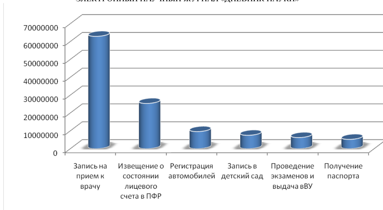
Рис. 1 – Перечень наиболее популярных запросов на порталах госуслуг.