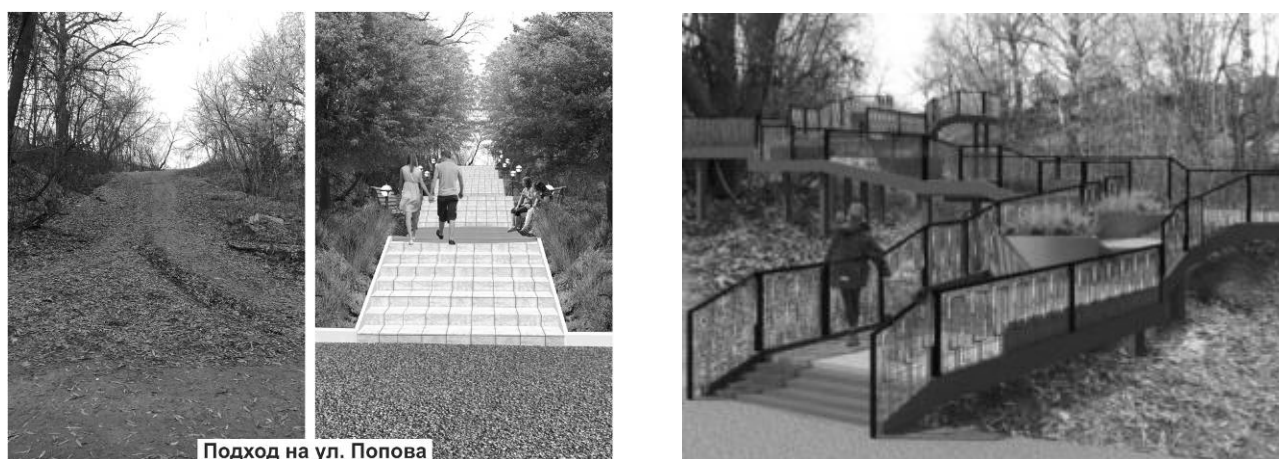
Рис.2 - Эскизное предложение подхода на ул. Попова от зоны родника «Самоварник» (Тропа Здоровья):

Здоровья» с «Олимпийской аллеей». Необходимая трансформация пешеходной связи территории «Тропы Здоровья» с парком может быть обогащена многоуровневыми площадками-спусками, позволяющими использовать существующее состояние рельефа для организации «прогулок вокруг верхушек деревьев» (рис.3). По рельефу организуются дополнительные пешеходные дорожки.