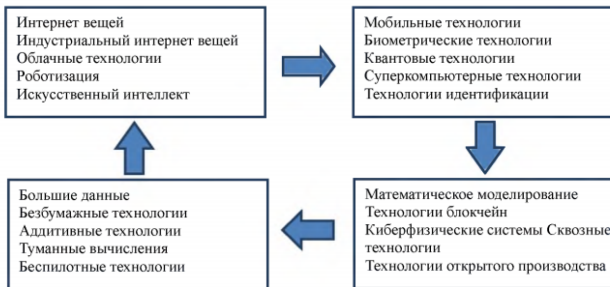
Рис. 1. Технологии цифровой трансформации экономики

Новые технологии в сочетании с развитием телекоммуникационных, компьютерных, банковских и других сетей создают возможности для быстрого перемещения информационных и денежных ресурсов по всему миру независимо от расстояния и времени [2, с. 14]. Интернет становится ключевой экономической инфраструктурой и служит платформой для инноваций, где используются ключевые цифровые технологии (рис. 1).