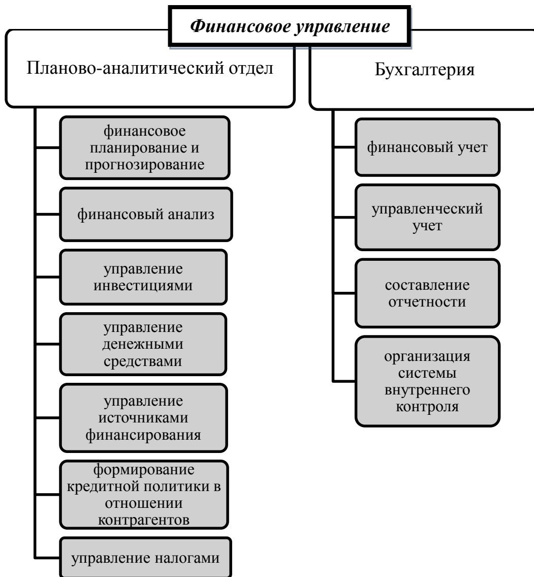
Рисунок 2. Пример организационной структуры управления финансовыми ресурсами

Независимо от того, какой подход к организации финансовой службы выбран руководством, оно стремится создать некую стандартную модель организации финансовой работы, отвечающую существующим экономическим реалиям.