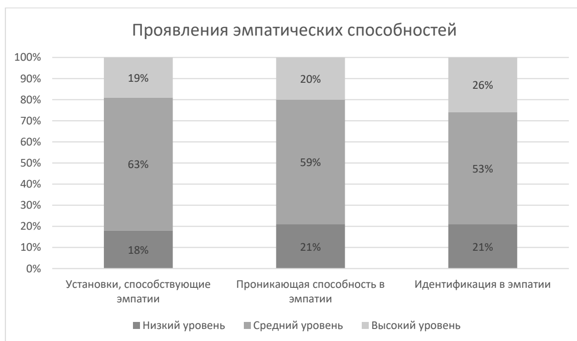
Рис. 3 - Проявления эмпатических способностей у студентов педагогических направлений

Проявления эмпатических способностей у студентов педагогических направлений также выражены сходным образом (рис. 3):