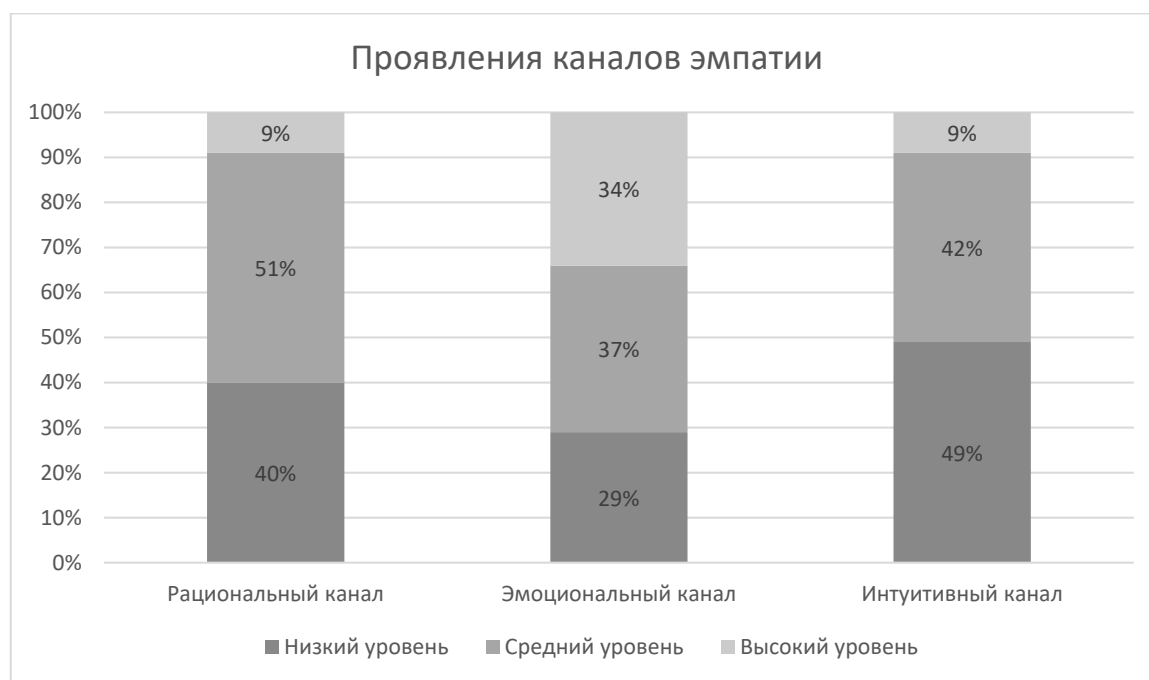
Рис. 2 - Проявления разных каналов эмпатии у студентов педагогических направлений (в %)

Отдельно важно рассмотреть результаты диагностики студентов педагогических направлений по отдельным каналам эмпатии (рис. 2).