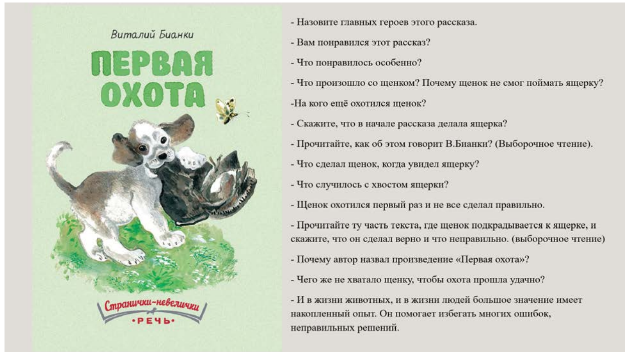
Рис. 2 «Анализ произведения В.В. Бианки «Первая охота»»

В процессе преподавания любого предмета книга становится верным помощником учителей. Применение художественной литературы, которая посвящена природе, не только обогащает образовательный процесс, но и способствует формированию познавательного интереса у детей. Вводя в уроки фрагменты рассказов, сказок или былин, преподаватель оживляет свой рассказ и поддерживает заинтересованность учеников. Яркие образы природы, созданные поэтами и писателями, усиливают эмоциональное восприятие и пробуждают у детей желание наблюдать за окружающим миром. Художественные произведения, как правило, содержат личную оценку событий. Когда дети читают такие тексты, они «переживают» их, испытывая разнообразные эмоции — от волнения до радости. Это способствует формированию любви и бережного отношения к природе.