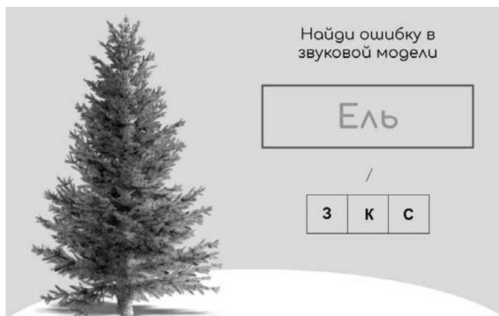
Рис. 2 – Пример задания для звукового анализа слова

(Задание направлено на формирование УУД анализа, контроля действий другого человека, подведения под понятия. В ходе мероприятия предлагается несколько предметных рисунков, в названиях которых наблюдается расхождение звукового и буквенного состава: ёж, календарь, якорь, ягода, степь, кольцо, юла ).