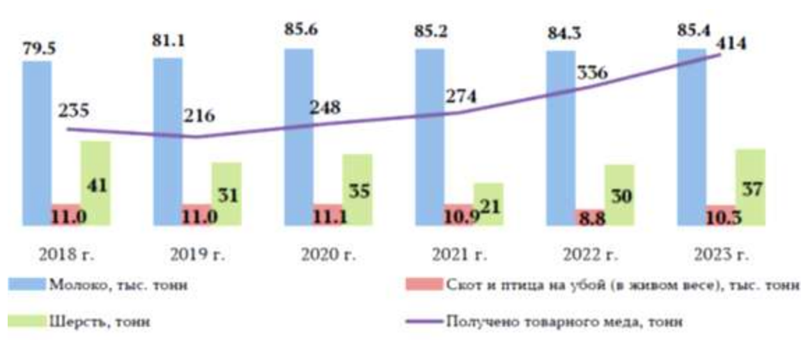
Рисунок 1. Производство продукции животноводства в крестьянских (фермерских) хозяйствах, включая ИП, Алтайского края [5]

В 2023 году фермерскими хозяйствами произведено 85,4 тыс. тонн молока (7,7 % от общего объёма производства в крае), 10,3 тыс. тонн скота и птицы на убой (в живом весе) (3,9 %), настрижено 37 тонн шерсти (13,7 %), получено 414 тонн товарного мёда (8,5 %) (рис. 1) [5].