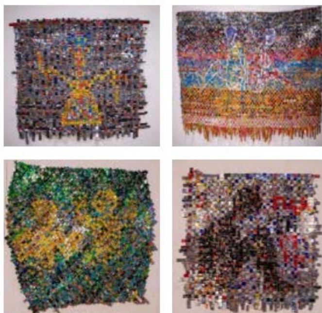
Рис.3. Металлические таписсерии Момина Садиа Ролана из алюминиевых полос [14].

создавать уникальные арт-объекты. Кроме того, использование переработанных алюминиевых банок в качестве основного материала является ключевым аспектом этой методики. Это позволяет не только эффективно использовать отходы и перерабатывать материалы, но также имеет положительное воздействие на окружающую среду и способствует борьбе с деградацией современной экосистемы, что особенно актуально для всех стран Африки.