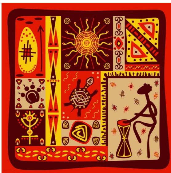
Рисунок 4. Дизайн ткани “Африканские мотивы” студентов ИВГПУ [11].

Африканские студенты, которые обучаются на кафедре дизайна костюма и текстиля по профилю “Дизайн текстиля”, получили в этом году уникальную возможность для реализации своих творческих идей. Под руководством преподавателей кафедры была подготовлена коллекция дизайна тканей “Африканские мотивы” для предприятия-работодателя ОАО “ХБК Шуйские ситцы”. Наиболее удачные работы были утверждены худсоветом комбината и будут запущены в производство (рис.4) [11].