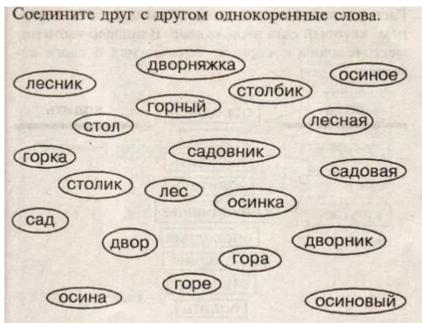
Рис.3 – Задание на поиск однокоренных слов

(Ответ: лесник, лесная, лес ; дворняжка ,двор, дворник; осина, осинка, осинковый; стол, столик; горный, горка, гора; сад, садовник, садовая)