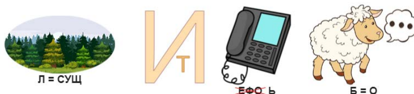
Рис.1 – Ребусы

( Ответы: 1.прилагательное 2.глагол 3.существительное)