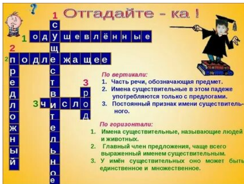
Рис.2 – Кроссворд

После решения кроссворда Словик вышел на тропинку и встретил незнакомого жителя, который напевал под нос песенку, да так, что его было слышно везде. Словику очень захотелось познакомиться с ним. И между ними состоялся такой диалог .