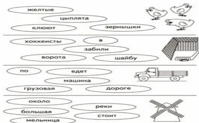
Рис.4 – Задание на составление предложения

(Ответ: Желтые цыплята клюют зернышки. Хоккеисты забили шайбу в ворота. По дороге едет грузовая машина. Около реки стоит большая мельница.)