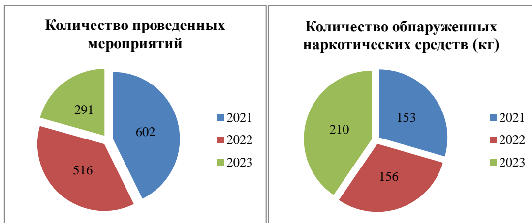
Рис.1 – Анализ данных о работе кинологических подразделений таможенных органов (разработано авторами)

Рост количества обнаружения наркотических средств за анализируемый период говорит о повышенной эффективности работы кинологических подразделений таможенных органов. Однако следует отметить, что в 2023 году наблюдается снижение количества обнаружения наркотических средств, психотропных и сильнодействующих веществ на 10%, это можно проследить на рисунке 2.