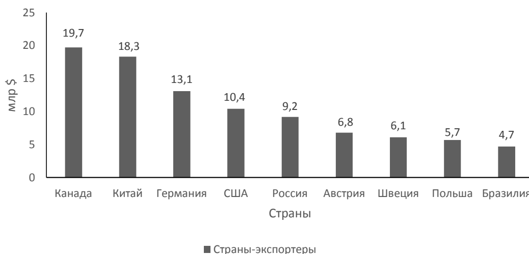
Рис. 1 Мировой экспорт древесины в стоимостном выражении [3]

Россия является экспортером лесопромышленной продукции, однако ее удельный вес в мировом ЛПК не более 3%. Мировой экспорт древесины по данным 2023 года в стоимостном выражении оценивается в 150 млрд. $. Россия с оборотом 9,2 млрд. $ занимает 5 место, уступая Канаде, Китаю, Германии, США (Рисунок 1).