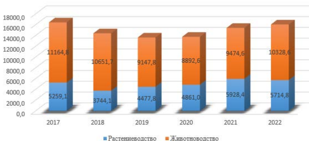
Рис. 2 – Продукция сельского хозяйства, млн. рублей [7].

Доля сельского хозяйства в формировании валового регионального продукта составляет 3,4%. В последние годы сельское хозяйство республики сохраняло основные показатели развития. Динамика изменения объема валовой продукции сельского хозяйства представлена на рисунке 2 [7].