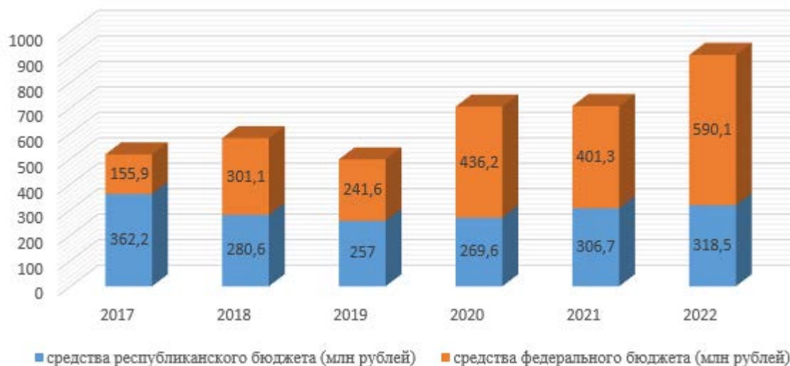
Рис. 4 – Поддержка сельхозтоваропроизводителей (млн рублей) [5].

Пищевая и перерабатывающая промышленность Республики Хакасия насчитывает 12 отраслей и порядка 180 предприятий крупного, среднего и малого бизнеса, в которых трудятся свыше 6 тыс. человек [7].