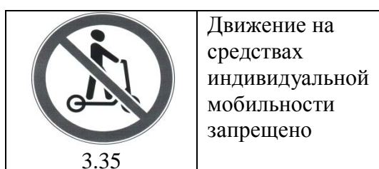
Рис. 1 – Дорожный знак 3.35

дорожного движения» (ТК 278) совместно с федеральным автономным учреждением «Российский дорожный научно-исследовательский институт» (ФАУ «РОСДОРНИИ») в целях реализации пункта 2 указанного постановления подготовлены и утверждены в федеральном агентстве по техническому регулированию и метрологии (Росстандарт) необходимые поправки в ГОСТ Р 52289-2019 «Технические средства организации дорожного движения. Правила применения дорожных знаков, разметки, светофоров, дорожных ограждений и направляющих устройств» и ГОСТ Р 52290-2004 «Технические средства организации дорожного движения. Знаки дорожные. Общие технические требования», в частности введено изображение дорожных знаков 3.35, 8.4.7.2 и 8.4.16 (Рис. 1, 2, 3), а также правила их применения.