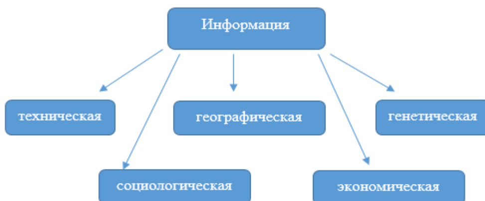
Рисунок 1. Классификация информации по сфере использования

4) обособленность. Проявляется в том, что для пользования большим кругом лиц информация всегда выводится в виде знаков, символов и в большинстве случаев существует опосредовано от своего создателя.