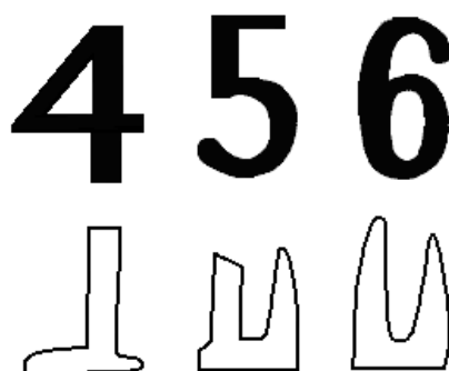
Рис. 2 – Вид проекции площади фигуры цифры на ось по горизонтали 2

Печатные буквы, цифры различались также с использованием самообучающихся ЭВМ. В этом случае изображения печатных фигур вводились с использованием фотоэлементов в запоминающее устройство ЭВМ. Процесс обучения ЭВМ включал такие части: