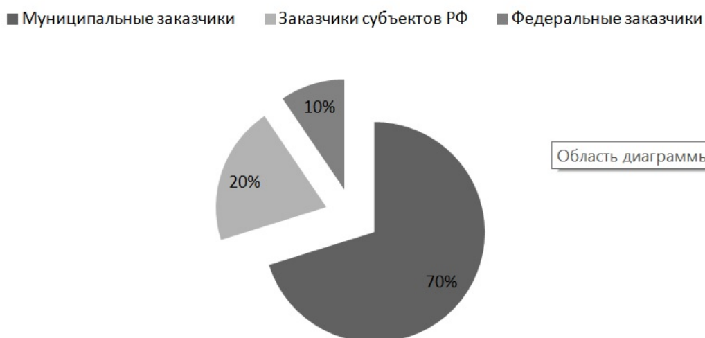
Рис.1– Доли основных заказчиков на рынке государственных закупок за 2019 год [3].

Согласно статистическим данным за 2019 год в России зарегистрировано 326306 участников закупок [3]. На основании данных Единой информационной системы в сфере закупок (ЕИС РФ) объемные доли основных заказчиков представлены на следующем рисунке (рис. 1)