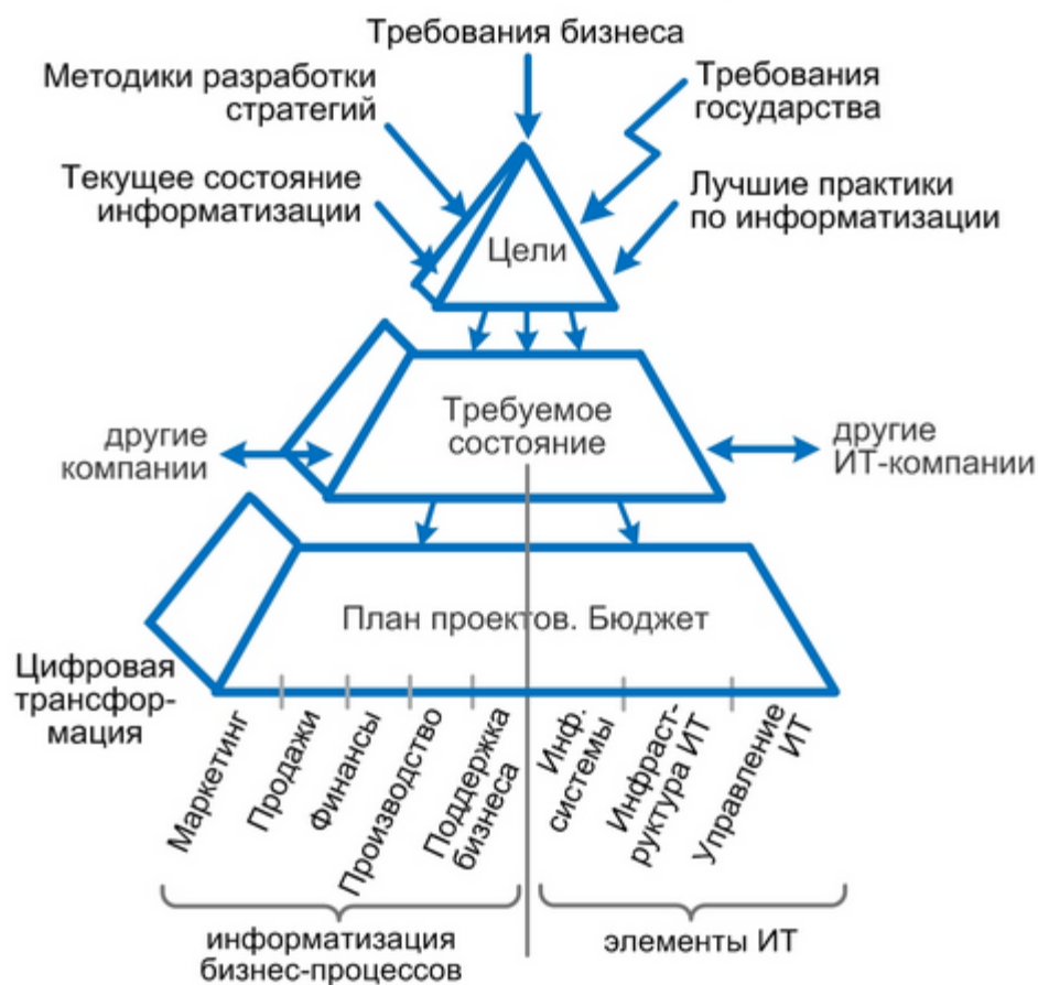
Рисунок 3. Полная стратегия цифровой трансформации организации [6]

Детализация стратегии цифровой трансформации представлена на рисунке 3.