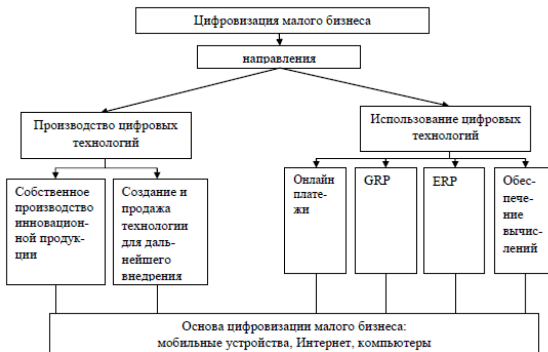
Рисунок 1. Процесс вовлечения бизнеса в цифровую экономику [3]

Таким образом, бизнес еще более ярко подчеркнул особенности реализации концепций b2b и b2c. В первом случае бизнес предоставляет новые технико-технологические решения для другого бизнеса, а во втором случае, бизнес внедряет предлагаемые ему цифровые решения, реализуя свою бизнес-концепцию на инновационной цифровой платформе, именно на этом этапе появляется эффективный бизнес, ориентированный на современного потребителя. Визуализация данного подхода представлена на рисунке 1.