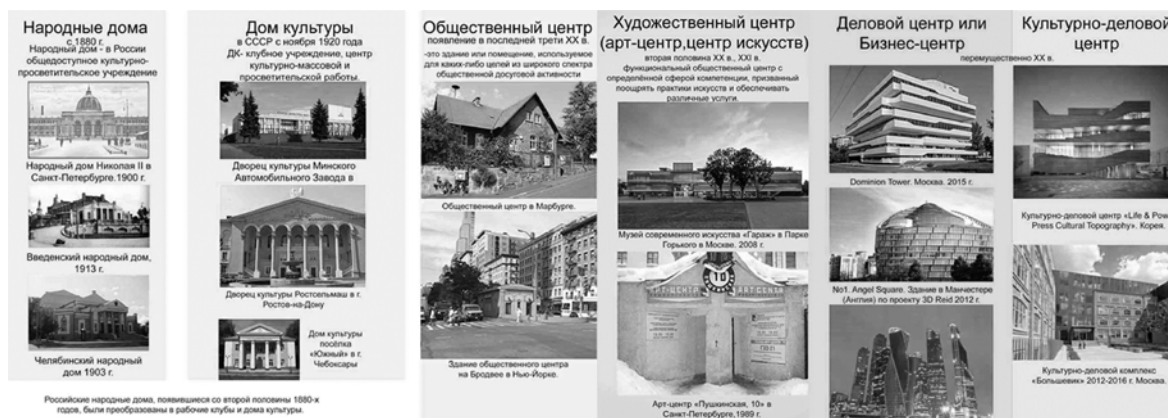
Рис.1 – Ретроспективный анализ.

Большинство общественных комплексов являются социально значимыми, создают акценты в городской среде, решают проблему пустующих промышленных территорий. При этом здания вписываются в структуру квартала, используют новаторские приемы, которые выделяют его из сложившейся среды.