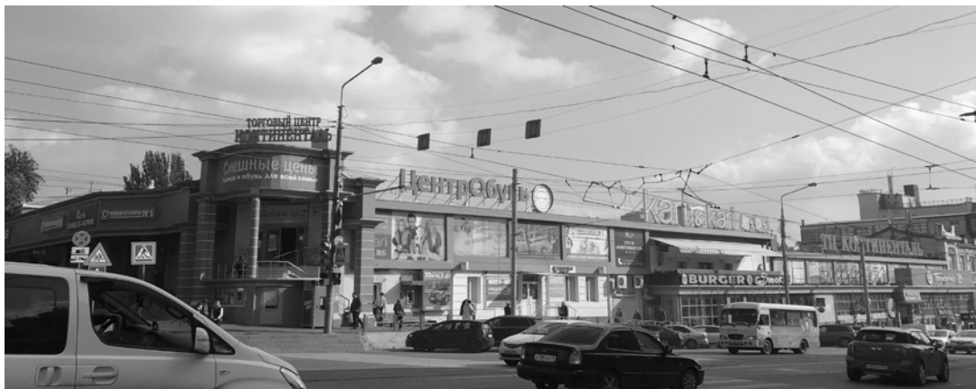
Рис 3. Пивзавод «Южная Бавария» (ныне торговый центр «Континенталь»)

Участок исследования расположен в хорошей транспортной и пешеходной доступности. Движение общественного транспорта осуществляется по улице Большая Садовая и проспекту Буденновский. Основное транспортное движение осуществляется по проспекту Буденновский и улице Пушкинская. Парковочные места на проектируемой территории будут размещены вдоль этих улиц. По ул. Пушкинская проходит пешеходная бульварная улица, которая связывает город с входом в парк М. Горького. Прилегающие территории достаточно озеленены, так как участок проектирования расположен в створе входа в парк им. М. Горького.