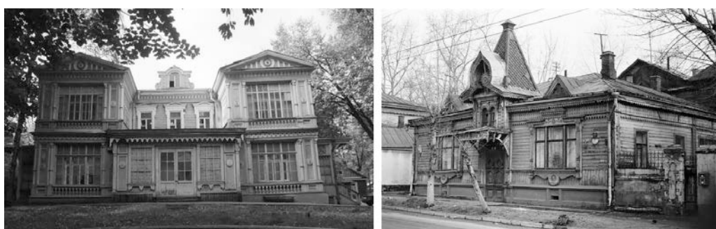
Рис. 3. - г.Москва, Дача Лямина, 6-й Лучевой протек,21 и Дом на улице Гастелло, 5 р-на Сокольники