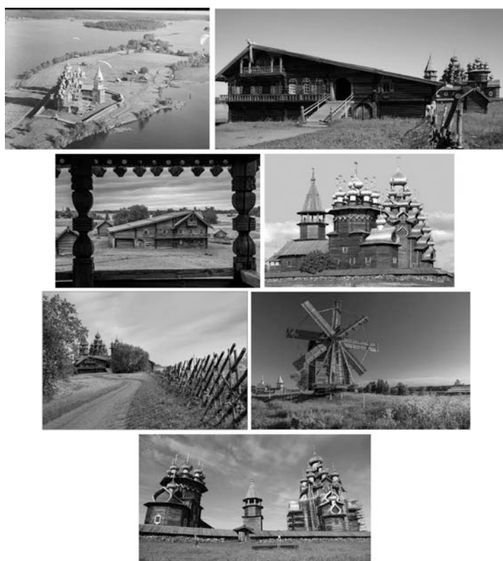
Рис. 1. - Россия, о. Кижы, Архитектурный ансамбль Кижского погоста