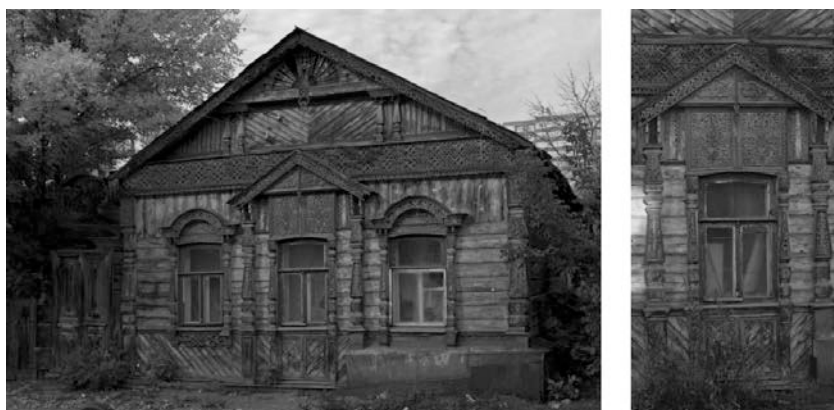
Рис. 6. - г. Пенза, Ул. Гладкова, д. 24.

Из фотофиксации объектов видно, в каком состоянии они находятся. Поэтому, систематически, возникает вопрос об экономической целесообразности сохранения ветхих деревянных зданий исторической среды.