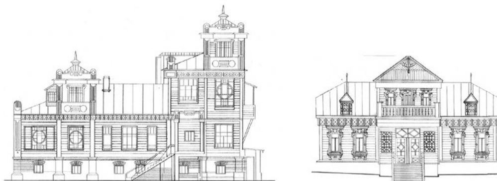
Рис.5. - Утраченные дома по Ул. Ключевского, 3а и Ул. Ключевского, 13

Дом по ул. Гладкова, 24 – относят к одному из лучших сохранившихся образцов богатого деревянного декора г. Пензы (Рис. 6). Отличающийся пензенский деревянный декор можно увидеть и на фасадах домов по ул. Чкалова, ул. Куйбышева (Рис.7).