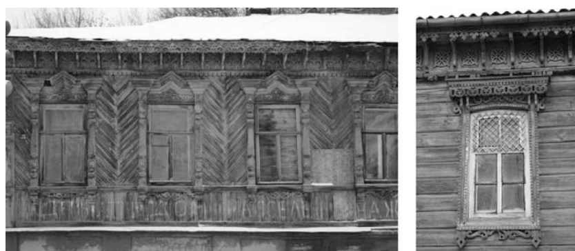
Рис. 7. - г. Пенза, элементы фасада по ул. Чкалова 13а и ул. Куйбышева.

Наряду с постепенной утратой памятников деревянного зодчества местного значения, в городе имеются современные деревянные постройки, что говорит о востребованности дерева как материала, и воплощения народных традиций в строительстве. Например, храм святителя Николая Чудотворца в р-не Ахуны г. Пензы (Рис.8). Его история началась в 1991 году, когда жители микрорайона Ахуны г. Пензы выступили с инициативой постройки молитвенного дома, а 19 декабря 1994 года храм был выстроен и освящён. В том виде, в котором Никольский храм можно видеть сегодня, был завершён лишь в 1999 году (архитектор Д. Борунов) [8].