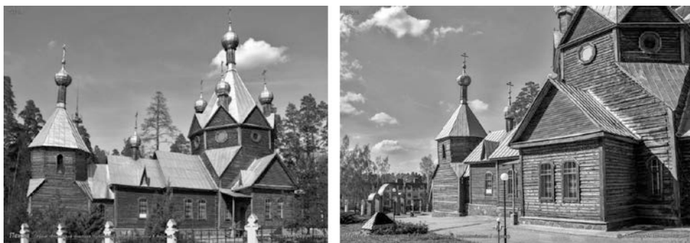
Рис. 8. - Храм святителя Николая Чудотворца в Ахунах.

Проблема изучения и сохранения объектов деревянного культурно – исторического наследия г.Пензы не потеряла актуальность на сегодняшний день. Исследование деревянного зодчества помогает глубже изучить историю родного края, создать более полный образ её архитектурно-градостроительной культуры и искусства, воспитать поколение, понимающее ценность деревянного наследия родного города.