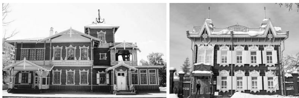
Рис. 2. г. - Иркутск, Усадьба В.П. Сукачева и Усадьба А.И. Шастина