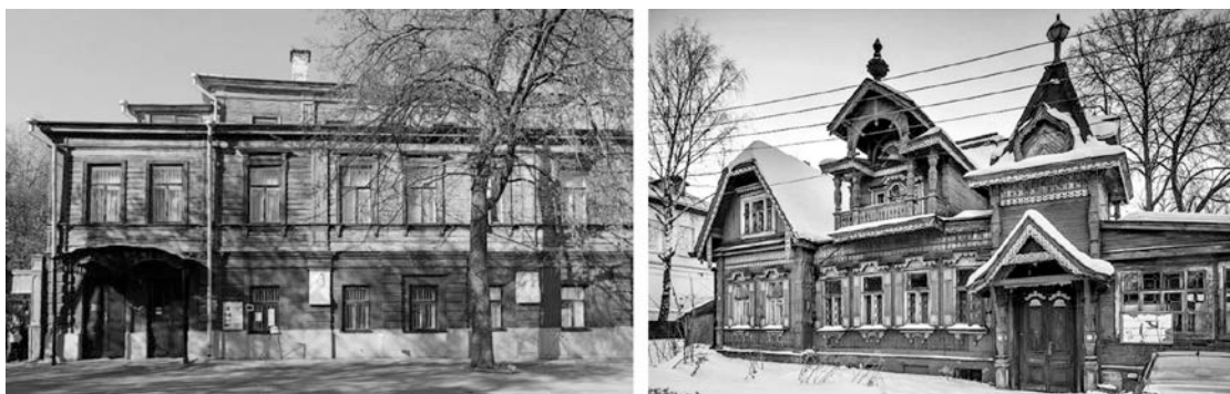
Рис. 4. - г. Нижний Новгород. Музей-квартира Максима Горького и Дом купца Смирнова.

Считается, что в Пензе имеется своеобразная школа деревянного зодчества. Но, к сожалению, постепенно утрачиваются объекты местного культурного значения [7]. Утрачен особняк по ул. Ключевского, 3а, демонстрировавший стиль «Модерн» с причудливыми башенками, балконами, верандами и открытыми лестницами, сложной формой кровли и пример размещения деревянного дома на рельефе, органично вписывавшегося в живописный ландшафт улицы Пензы (рис.5). Деревянный дом с мезонином по ул. Ключевского, 13 и многие другие [6].