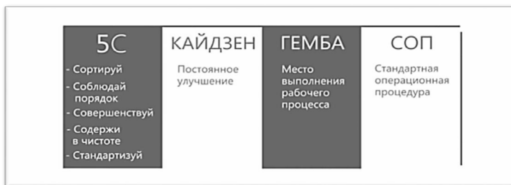
Рисунок 2. Бережливое производство 5С

Бережливое производство - это подходы, методы, направленные на уменьшение всех возможных издержек и увеличение производительности.