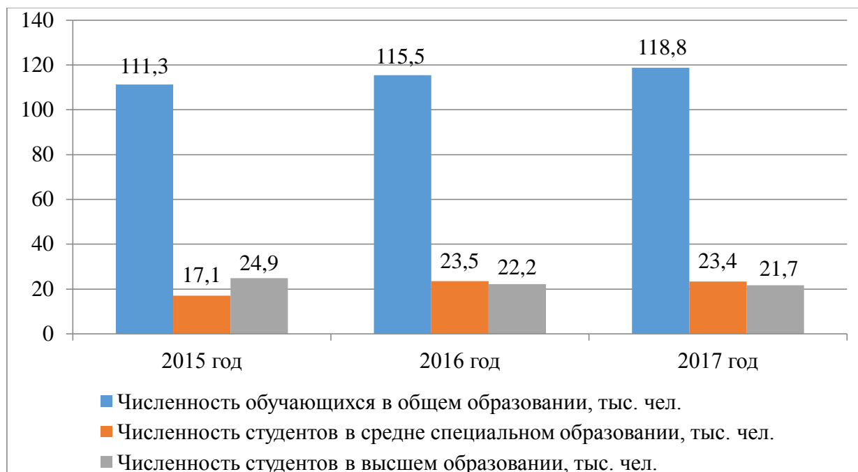
Рис. 1 – Динамика численности обучающихся в регионе за 2015-2017 годы

По данным рисунка видно, что более 23 тыс. чел – это студенты 30 профессиональных образовательных учреждений, реализующих программы подготовки рабочих, служащих и специалистов среднего звена. В регионе более 21 тыс. чел. – студенты высших образовательных учреждений. В системе профобразования обеспечивается подготовка кадров по 42 профессиям и 73 специальностям среднего профобразования, по 117 профессиям в рамках программ профессионального обучения. В регионе обеспечено активное функционирование 6 отраслевых производственно-образовательных кластеров, 8 многофункциональных центров прикладных квалификаций, 2 ресурсных центров, а также 2 инновационно-образовательных центров.