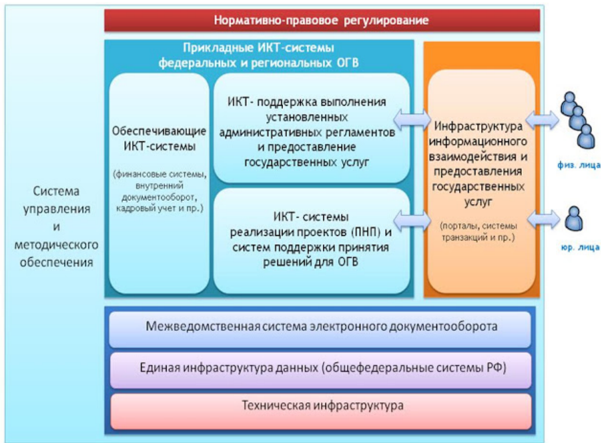
Рис. 1. Концептуальная архитектура электронного правительства 2

До того, как появился Интернет, правительство оповещало граждан о своей деятельности при помощи доступных тогда технологий (печать, радио, телевидение). В настоящее же время, процесс широковещательного информирования упрощен, т.к. используется интерактивный процесс предоставления электронных информационных услуг, который поддерживается взаимодействием различных управленческих структур. Довольно часто используется специальное приложение, с помощью которого можно заполнить официальный бланк и отправить его по электронной почте – это лишь один из примеров взаимодействия электронного правительства с информационной системой (см. рис.2).