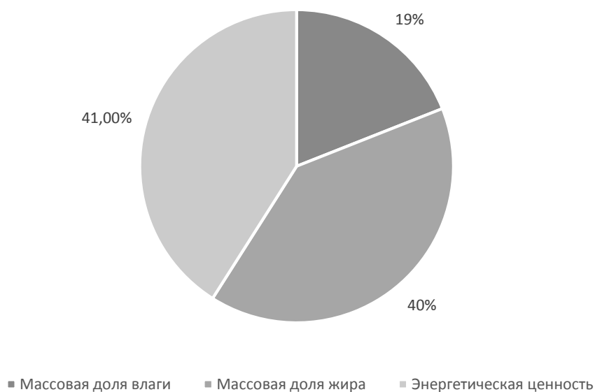
Рисунок 3- Физико-химические показатели