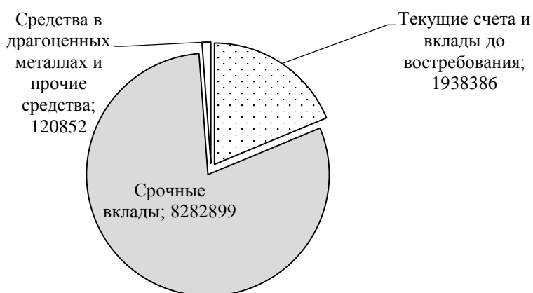
Рис. 2 - Структура средств физических лиц Сбербанка в 2015 г., млн. руб.

объем валютных вкладов в долларовом эквиваленте. Часть вкладов открыта в удаленных каналах [4].