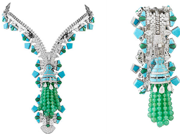
Рис. 1 - Колье – браслет «Zip»

Нужно отметить, что многофункциональные украшения получили настоящее призвание благодаря герцогине Виндзорской в 1954 году. Она заказала в фирме Van Cleef & Arpels колье – браслет «Zip». Изделие представляет собой «молнию», в открытом состоянии оно использовалось как оригинальное колье, а в закрытом – эффектный браслет. Оно было изготовлено из драгоценных металлов и украшено рубинами (рис. 1).