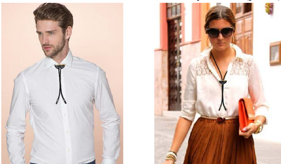
Рис. 4 – Эгрет с использованием подвижного зажима

Используя подвижный зажим, эгрет можно будет использовать как галстук болло, зафиксировав зажим на уровне самой верхней пуговицы рубашки или расположив его на любом другом расстоянии от воротника, эти варианты одинаково подходят как женщинам, так и мужчинам (рис. 4).