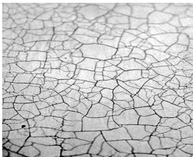
Рис.3 – Эффект кракелюра на металле

В художественной обработке материалов, в частности в изготовлении украшений из драгоценных и цветных металлов, защитно-декоративные покрытия используются для защиты изделий от коррозии и дизайна [1]. Защитная функция таких покрытий обусловлена непроницаемостью, образующейся после нанесения пленки, в то время как дизайнерский подход состоит в отображении