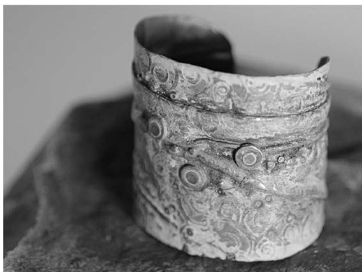
Рис.2 – Браслет с патиной